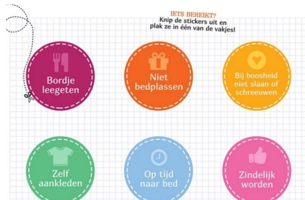
Voorbeeld van beloningsstickers

Moet je je ene kind altijd achter de broek zitten met zijn huiswerk, terwijl de ander dit braaf uit zichzelf doet? Geef dan niet alleen aandacht aan het kind dat niet doet wat er wordt verwacht. Beloon je andere kind ook eens voor zijn goede gedrag, ook al is dit vanzelfsprekend bij hem.